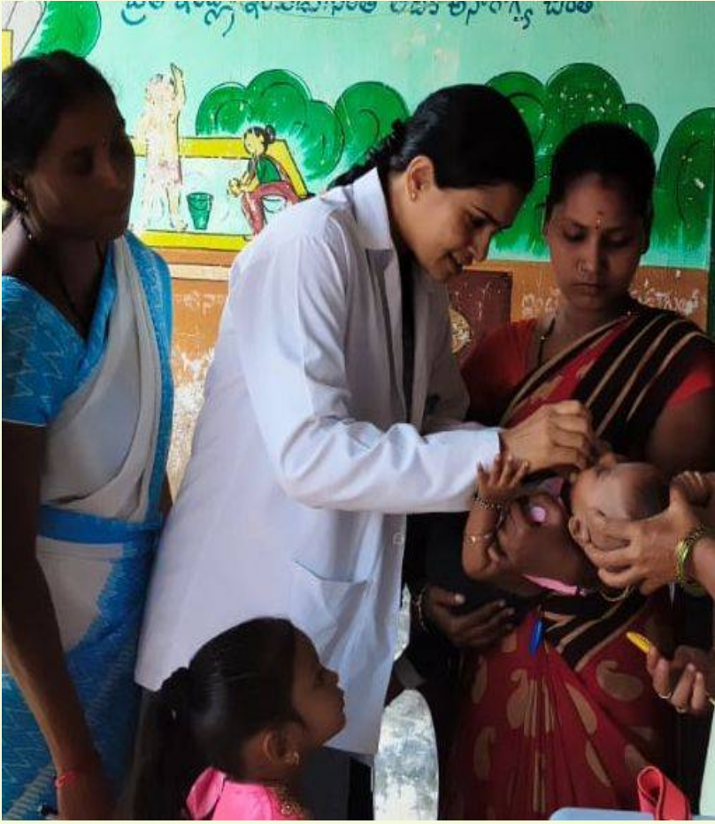
నేటి ప్రభాతదర్శిని బాన్సువాడ ప్రతినిధి

బాన్సువాడ మండలంలోని హనుమాజీపేట ప్రాథమిక ఆరోగ్య కేంద్రం పరిధిలో నిర్వహించిన పల్స్ పోలియో కార్యక్రమం అనుకున్న లక్ష్యాన్ని చేరువలో విజయవంతంగా పూర్తయింది. 5 సంవత్సరాల లోపు పిల్లలకు పోలియో చుక్కలు వేసే ఈ కార్యక్రమంలో 95% కవరేజ్ సాధించారు.