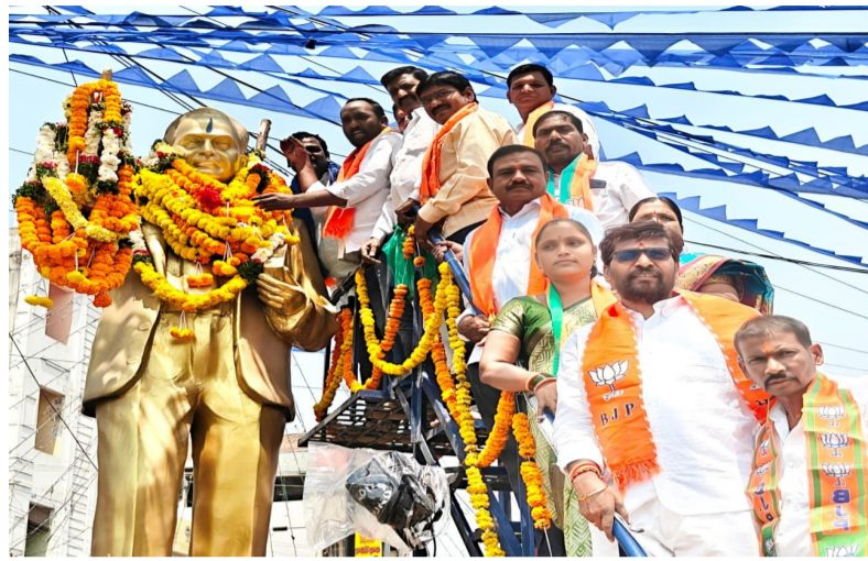
నేటి ప్రభాత దర్శిని బాన్సువాడ ప్రతినిధి.